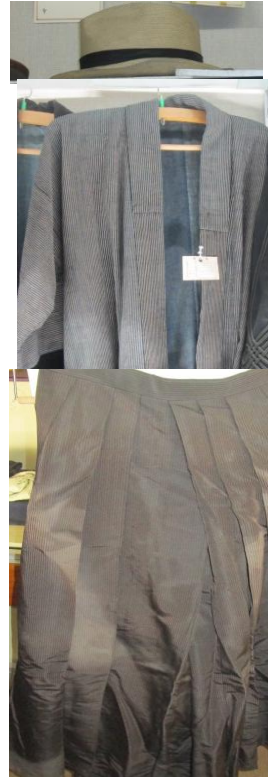
No.25 ときやこころう 時屋小五郎 通称「小五郎」

資料館第2展示室の衣装コーナーから生まれた付喪神キャラクターである。「怪盗クロック」の悪事を制するべく、第2展示室の入り口側で待機する。